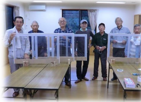
枠を貼り合わせ・台をつけ