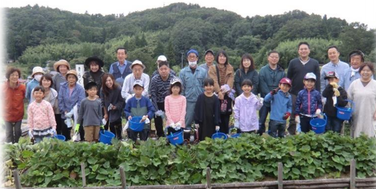
1・2年生がさつまいも掘りをしたよ！