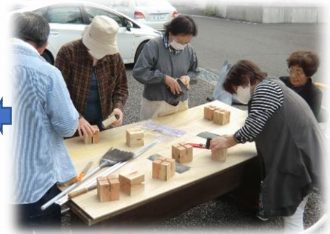
木製の台をやすりで研ぎ