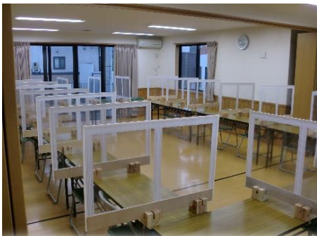
机の上に並べて完成!!