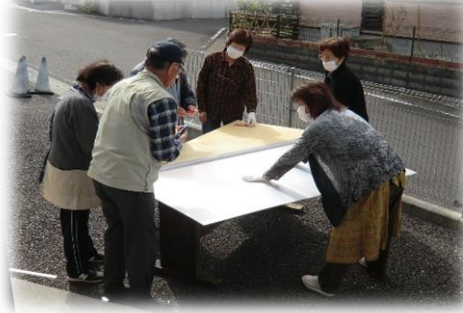
枠や透明板の採寸と裁断をし