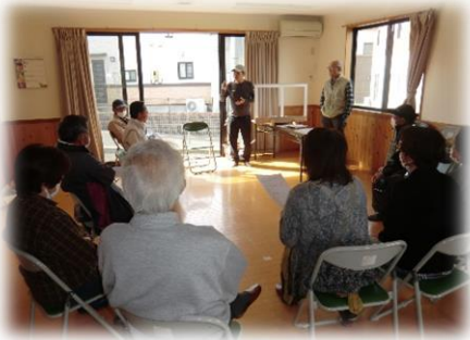
設計者から作業の段取りを聞き