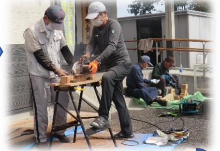
木材で台を作りノミで溝を彫り