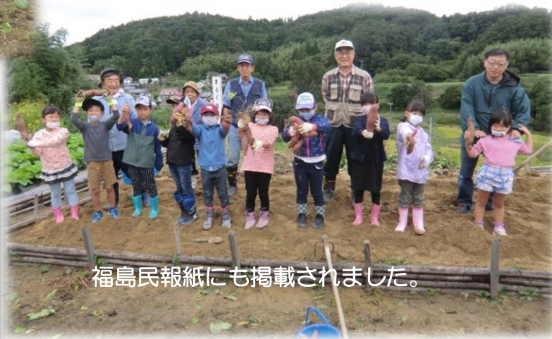
福島民報紙にも掲載されました。

きらくな会、大忙しです。飛沫防止板の作成には、 町内会より予算を頂き、苦心の末、完成まで 2日間を要しました。少しでも皆さんの お役に立てればうれしいです。